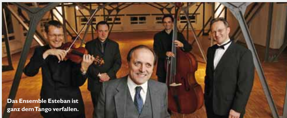
Das Ensemble Esteban ist ganz dem Tango verfallen.